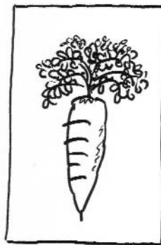
CAROTTE BIO 16%