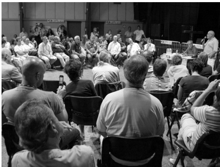
Réunion du 5 septembre à Blanquefort à l'initiative de la CGT-Ford